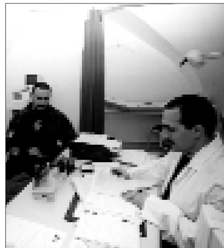
Vor der Übergabe an eine palästinensische Trägerorganisation wurde eine umfangreiche Renovierung der »Austro-Arab Community Clinic« mit österreichischer Hilfe durchgeführt.