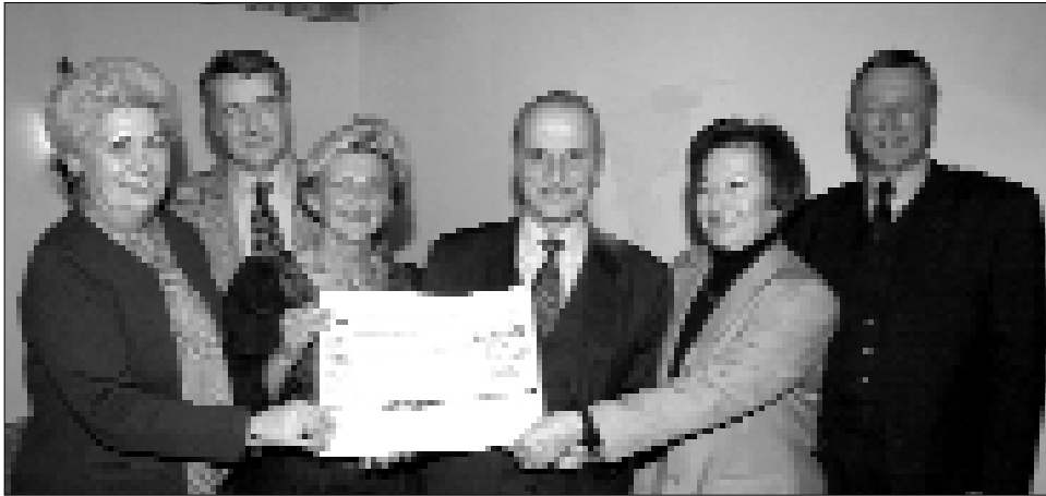
Mitglieder der Initiative aus Hainburg bei der Übergabe des Unterstützungsschecks über öS 37.000,-.

Gesellschaft bestand in der Durchführung einer österreichischen Kulturwoche im Oman vom 11.-19.2.2000. Über diese äußerst erfolgreiche Veranstaltungsreihe werde ich im nächsten Bulletin genauer berichten.