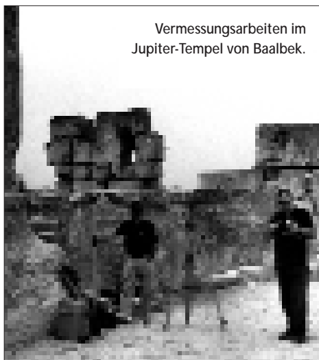
Vermessungsarbeiten im Jupiter-Tempel von Baalbek.