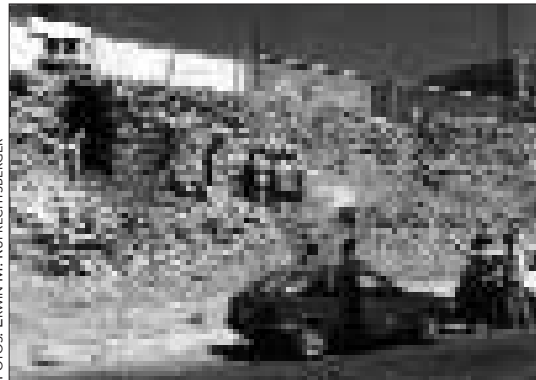
Freileigungsarbeiten im Bereich des Mauerturmes der Militärfestung