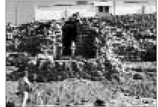
Auf dem nun ausgegrabenen, ursprünglichen Begehungsniveau im Erdgeschoss des Mauerturmes findet eine Lagebesprechung statt

Derzeit laufen intensive Arbeiten, um Hunderte von elektronisch gespeicherten Daten für die Plangrundlagen zu ordnen und auszuwerten, um letztlich von einer Diskette in Sekundenschnelle abgerufen und am Bildschirm des PC dargestellt werden zu können. Am Institut für Gesteinskunde und feuerfeste Brennstoffe der Montan-Universität Leoben hat Prof. Dr. Anton Meyer Mörtelproben aus der Militärfestung, die aufgrund ihrer besonderen Dichte an Holzkohleresten auffielen, eben analysiert. Sein Gutachten enthält auch den Hinweis auf eine hohe Konzentration an Muschelresten im Mikrobereich, was auf die Verwendung von Meeressand (unter Vermeidung von Salz) zurückzuführen ist. Ein erster Einblick in die »Werkstatt« der Forscher konnte anlässlich des Länder-