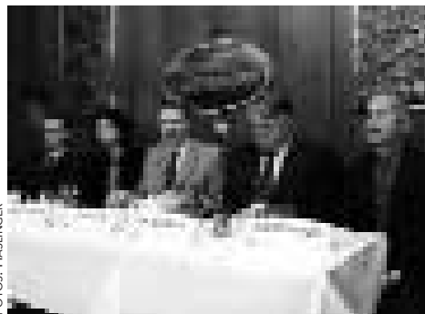
Pressekonferenz der GÖAB zur humanitären Situation im Irak

Abschließend sei noch erwähnt, dass vom Oktober bis Ende Dezember 2000 insgesamt drei irakische Fachärzte in Österreich zu jeweils zweimonatigen Trainingskursen weilten. Anfang 2001 wird eine Gruppe von drei ÄrztInnen nach Wien kommen. ❖