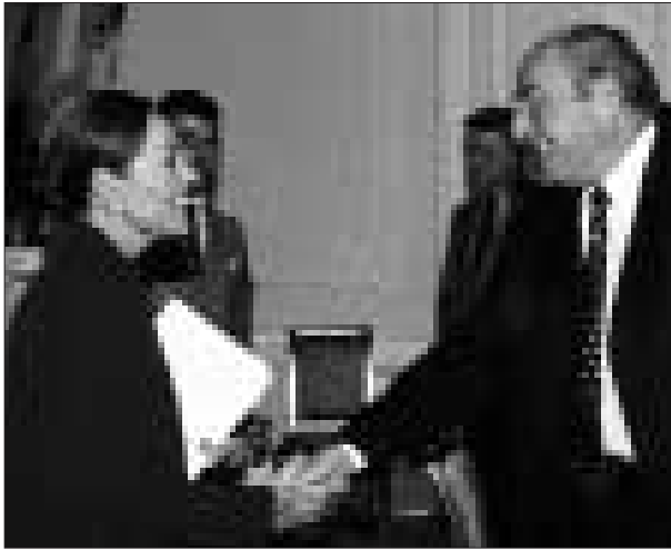
Außenministerin Benita Ferrero-Waldner begrüßt Faisal Hussein

druck gebracht werden. Darüber hinaus wurde auch für humanitäre Projekte Geld gesammelt. (Bei den drei im Oktober, November und Dezember durchgeführten Veranstaltungen konnten etwas mehr als öS 150.000,- eingenommen werden.) Die erste Veranstaltung fand am 28.10.2000 im Kongresshaus am Margaretengürtel statt. Trotz der extrem kurzen Vorbereitungszeit von 14 Tagen war der Besuch (ca. 250 Personen) sehr gut und auch das finanzielle Ergebnis (ca. öS 120.000,-) konnte sich sehen lassen.