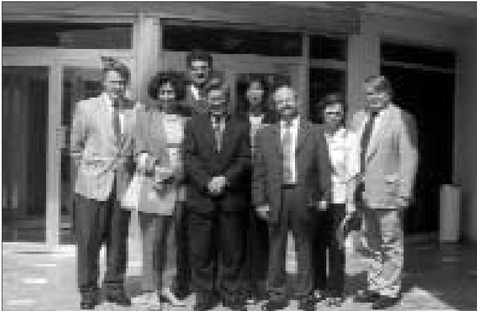
Die GÖAB-Delegation mit dem UN-Koordinator Tun Myat vor dem UN-Hauptquartier in Bagdad

als auch die GÖAB, werden die Klinik weiter unterstützen und auch dem Aufsichtsrat der Klinik angehören. Es wird sicherlich in einem unserer nächsten Bulletins ausreichend Platz geben, um dieses österreichische Paradeprojekt in Jerusalem noch genauer zu beschreiben.