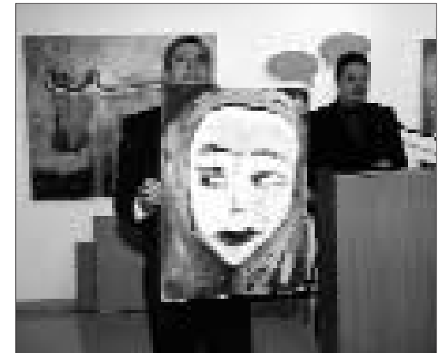
Insgesamt kamen über 70 Gemälde zur Versteigerung