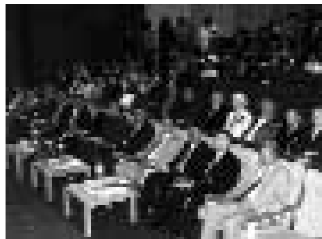
Eröffnungssitzung des österreichischen Ärztekongresses in Bagdad