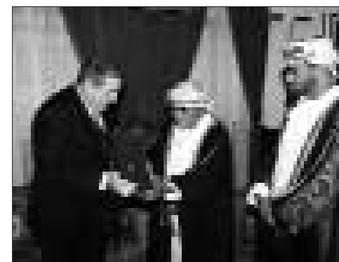
Botschafter Coreth bei der feierlichen Überreichung des Ordens an Seine Hoheit Sayyed Faysal

Einer der ganz besonderen Freunde Österreichs in der Arabischen Welt, der omanische Minister für Kultur und Nationales Erbe, Seine Königliche Hoheit Sayyed Faysal Bin Ali Al Said, erhielt mit dem »Großen Goldenen Ehrenzeichen am Bande