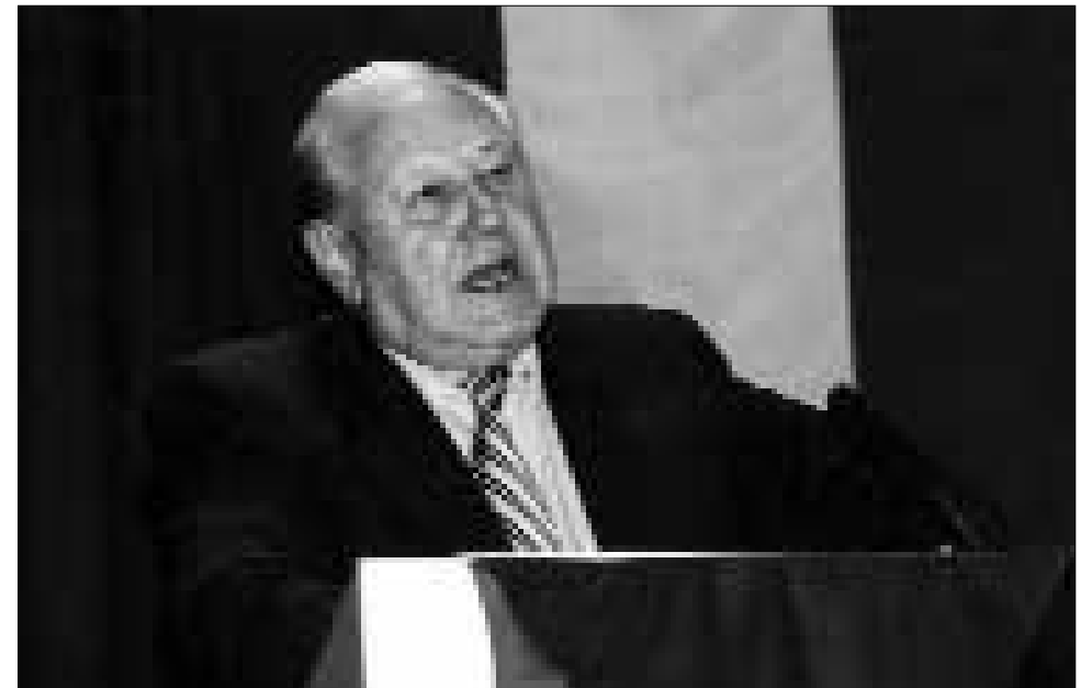
GÖAB-Präsident Karl Blecha bekundet seine Solidarität mit dem palästinensischen Volk