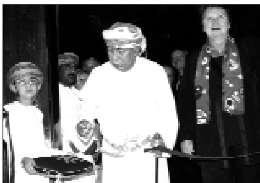
Hoheit Sayyid Faisal bin Ali al Said und Dr. Hilde Hawlicek bei der Ausstellungseröffnung in Maskat.

In unserer letzten Ausgabe haben wir bereits über die Gründung der Österreichisch-Omanischen Gesellschaft berichtet. Diese neue Gesellschaft wurde am 21.10.1999 gegründet und ihr gehören Persönlichkeiten aus Politik, Kultur und Wirtschaft an. Als Präsidentin wurde