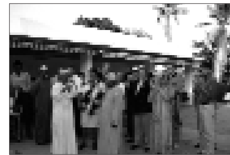
Hoheit Sayyid lud die österreichische Delegation auf seine private Farm ein.

Schließlich sei noch erwähnt, dass während des Aufenthaltes der österreichischen Delegation auch ein von VAMED Engineering errichtetes privates Spital offiziell übergeben worden ist. Die feierliche Übergabe fand im Rahmen eines Wiener Operettenabends im Hotel Intercontinental in Maskat statt. Diese erste Aktivität der Österreichisch-Omanischen Gesell-