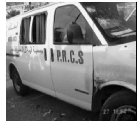
Sogar Rettungswagen werden vom israelischen Militär unter Beschuss genommen

Gesellschaft für Österreichisch- Arabische Beziehungen Wien, 1.4.2002