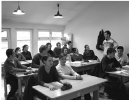
Die SchülerInnen der 12. Klasse

Das war der eigentliche Auslöser des Projekts.