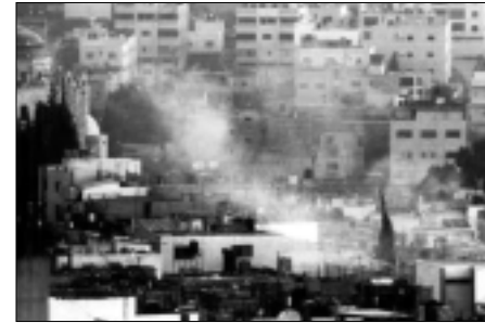
Israelische Panzer zerstören Häuser in den palästinensischen Autonomiegebieten

treibung von 750.000 Palästinensern begonnen und was er persönlich 1982 (Invasion im Libanon, Besetzung Beiruts und Vertreibung der PLO) nicht vollenden konnte: Die Vernichtung der palästinensischen Nationalbewegung, ja die physische Liquidierung des politischen Führers des palästinensischen Volkes, Yasser Arafat. Auch wenn viele Beobachter und Kommentatoren die Aussagen Sharons, wonach er bedauert, 1982 die »Sache nicht zuende gebracht zu haben«, nicht ganz ernst genommen haben, so rechtfertigte Sharon seinen seit 1982 unter Arabern geläufigen Beinamen (»Schlächter von Beirut«) in den letzten Wochen und Monaten leider nachdrücklich. Eine immer brutaler und hemmungsloser agierende Armee (wer erinnert sich nicht mit Schrecken an die Geschmack- und Instinktlosigkeit, palästinensischen Gefangenen zur leichteren Identifizierung Namen und Häftlingsnummern auf die Arme zu schreiben!) beschränkte sich nicht darauf, vermeintliche Terroristen zu verfolgen, sie besetzten Städte, Dörfer und Flüchtlingslager, zerstörten Hunderte, ja Tausende Häuser und töteten Hunderte Menschen, zumeist Zivilisten, die kaum in irgend welche Kampfhandlungen verstrickt waren. Dass sich dann unter den Toten auch Ärzte, Sanitäter, Fahrer von Rettungswagen und schlussendlich sogar Journalisten befanden, kann man nur dem Blutausch einer Besatzungsmacht zuschreiben, die sich hinsichtlich der politischen Rückendeckung ihrer Handlungen keine Gedanken zu machen braucht.