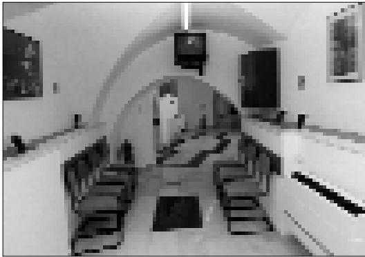
Die Klinik in Jerusalem soll demnächst übergeben werden.

Wir sind als GÖAB nun mit der höchst schwierigen Situation konfrontiert, einerseits die Klinik wirtschaftlich völlig zu sanieren sowie andererseits die Vorbereitungen für die Übergabe an Maqassed zu treffen. Bis dato haben wir noch einige schwere Brocken vor uns, ich hoffe aber, dass wir vor allem mit Unterstützung der EZA aber auch einiger anderer FreundInnen und SponsorInnen die Klinik innerhalb der kommenden Monate soweit konsolidieren können, dass dieses Vorzeigeprojekt der österreichischen Palästina-Hilfe auch weiterhin erfolgreich bestehen wird können. Leider verliert man im Stress der Bewältigung aktueller Krisen sehr oft eines aus den Augen, dass nämlich das eigentliche Projektziel voll und ganz erreicht werden konnte. Dank der österreichischen Klinik ist die primäre Gesundheitsversorgung der palästinensischen Bevölkerung in Ost-Jerusalem heute ganz wesentlich besser als noch vor fünf Jahren!