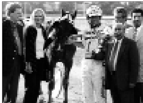
Seine Hoheit Sayyid Faisal bin Ali al Said bei der Überreichung des Siegerpokals.