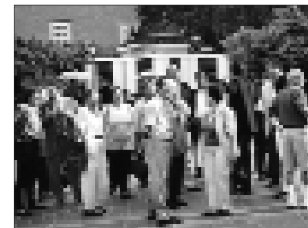
Die arabischen Botschafter bei der Stadtbesichtigung.