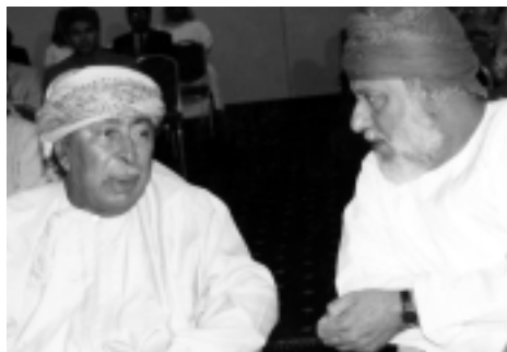
Der omanische Kulturminister bei der Eröffnung der österreichischen Kulturwoche im Vorjahr

Am 7.5. wurde im Rahmen eines Empfanges des omanischen Ministers für Kultur und nationales Erbe, S.H. Sayyid Faisal bin Ali-Said, in Wien das 15jährige Jubiläum des »Österreichisch-Omanischen Kulturabkommens« gewürdigt. Im Rahmen dieser äußerst erfolgreichen Kooperation wurden zahlreiche Aktivitäten gesetzt, zuletzt eine österreichische Kulturwoche im Februar 2000 in Maskat sowie der Auftritt