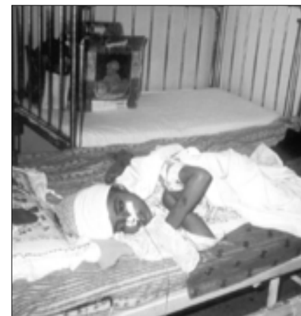
Die Leukämie-Rate unter irakischen Kindern ist seit 1990 um ein Vielfaches angestiegen

In Basra kann derzeit kein einziges Kind mit