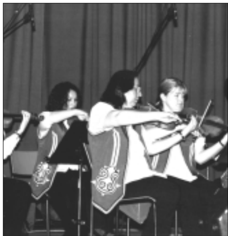
Die jungen ägyptischen MusikerInnen begeisterten das österreichische Publikum

Das Ensemble wurde im Jahre 1998 gegründet und besteht aus jungen Absolventinnen der Kunstakademie »Conservatoire – Arabic Music Institute« in Kairo, welche in vielerlei Hinsicht zur Erhaltung und Verbreitung des arabischen Musikerbes