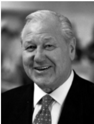
GÖAB-Präsident Karl Blecha wehrt sich gegen den Vorwurf des Antisemitismus

In einer Pressesaussendung nahm heute die »Gesellschaft für Österreichisch-Arabische Beziehungen« (GÖAB) zu den Angriffen von ÖVP- und FPÖ-Funktionären auf ihren Präsidenten, BM a.D. Karl Blecha, Stellung. Die in einer anlässlich des Internationalen Solidaritätstages mit dem palästinensischen Volk unmissverständlich zum Ausdruck gebrachte Verurteilung der Okkupationspolitik Israels habe wahrlich nichts mit Antisemitismus zu tun, heißt es in dieser Erklärung. Die durch zahllose einschlägige Beschlüsse der Vereinten Nationen, der Europäischen Union und verschiedenster internationaler Organisationen seit vielen Jahren untermauerte scharfe Kritik Blechas habe auch nichts mit der aus durchsichtigen innenpolitischen und anderen Motiven zu Stande gekommenen Privatfehde des »einfachen FPÖ-Mitglie-