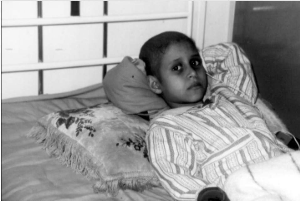
Die GÖAB-Hilfsaktion kommt den krebserkrankten Kindern im Irak zugute

Leukämie geheilt werden. Die insgesamt 70 Kinder der Kinderstation werden von nur zwei Krankenschwestern versorgt. Die Mütter werden daher immer mit aufgenommen und schlafen teilweise – mangels Betten – am Fußboden neben dem Bett ihres kranken Kindes.«