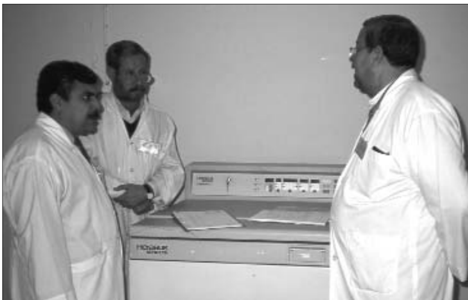
Die Ärzte in der Blutbank von Basra bei der Inbetriebnahme der Blutzentrifuge.