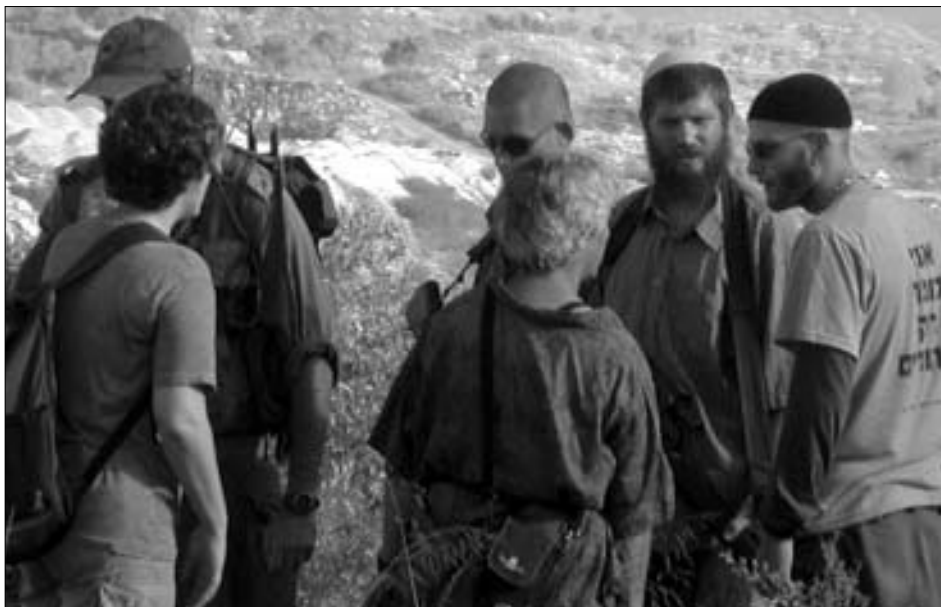
IWPS-Frauen in Konfrontation mit den Siedlern.

Am frühen Morgen, als wir alle zum angegebenen Ort kamen, warteten bereits ca.