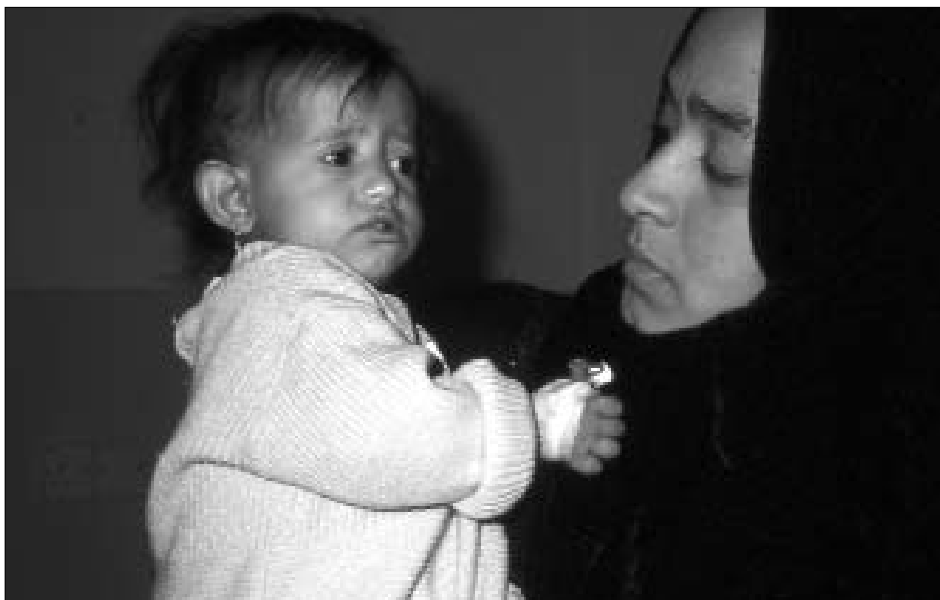
Für die irakische Zivilbevölkerung stellt unsere Hilfe einen Funken an Hoffnung dar.

transportiert werden sollten – werden sie dort auch ankommen, werden sie unbeschädigt sein? Endlich, nach so langer Vorbereitungs- und Wartezeit wollten wir die erste Projektphase abschließen und kamen damit in die Endphase der Entscheidung über einen neuerlichen Krieg.