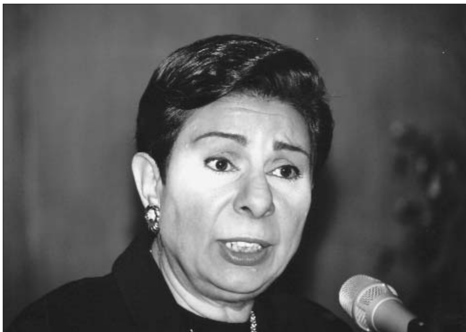
Dr. Hanan Ashrawi spricht anlässlich ihres Wien-Aufenthaltes über die »Solidarität mit Palästina«.